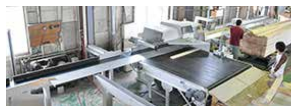
自動オプティカットソー