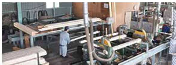
プレーナーギャング

高精度、高品質な製品を提供すると共に、お客様の多様化するニーズに対応するため、低コスト、スピーディ、フレキシブルな生産体制を、安全性を重視して構築しています。